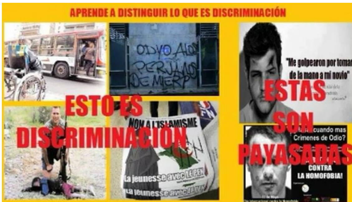
Captura del vídeo de YouTube ¿Qué pretende la ideología sodomita?

Els 33 continguts denunciats són accessibles en obert a Internet. En concret, hi ha 26 vídeos de YouTube, 1 vídeo de Dailymotion, 2 fòrums, 2 pàgines web i 2 blogs. Els vídeos han tingut 1.406.491 visualitzacions i han generat prop de 5.000 comentaris.