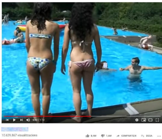
Captura del vídeo grabado en un parque acuático que ha conseguido más de 10 millones de visualizaciones por haber sido incluido en 11 listas de reproducción, con títulos como Panty&bikini, Pool Sluts o Putillas.

El informe del CAC constata también que la viralización es una característica común de los vídeos de menores que han sido incluidos en una o varias listas de reproducción de temática sexual. Por ejemplo, uno de los vídeos analizados, con más de 10 millones de visualizaciones y en el que aparecen dos niñas en bañador que juegan en una piscina, aparece en 11 listas de reproducción diferentes que se presentan con títulos como Pool Sluts (“putas de piscina”), Putillas , Sexy vids2 u omg! Booty (“¡Oh, Dios mío! Culos”) y que, además, incluyen contenidos de carácter erótico en diferente proporción.