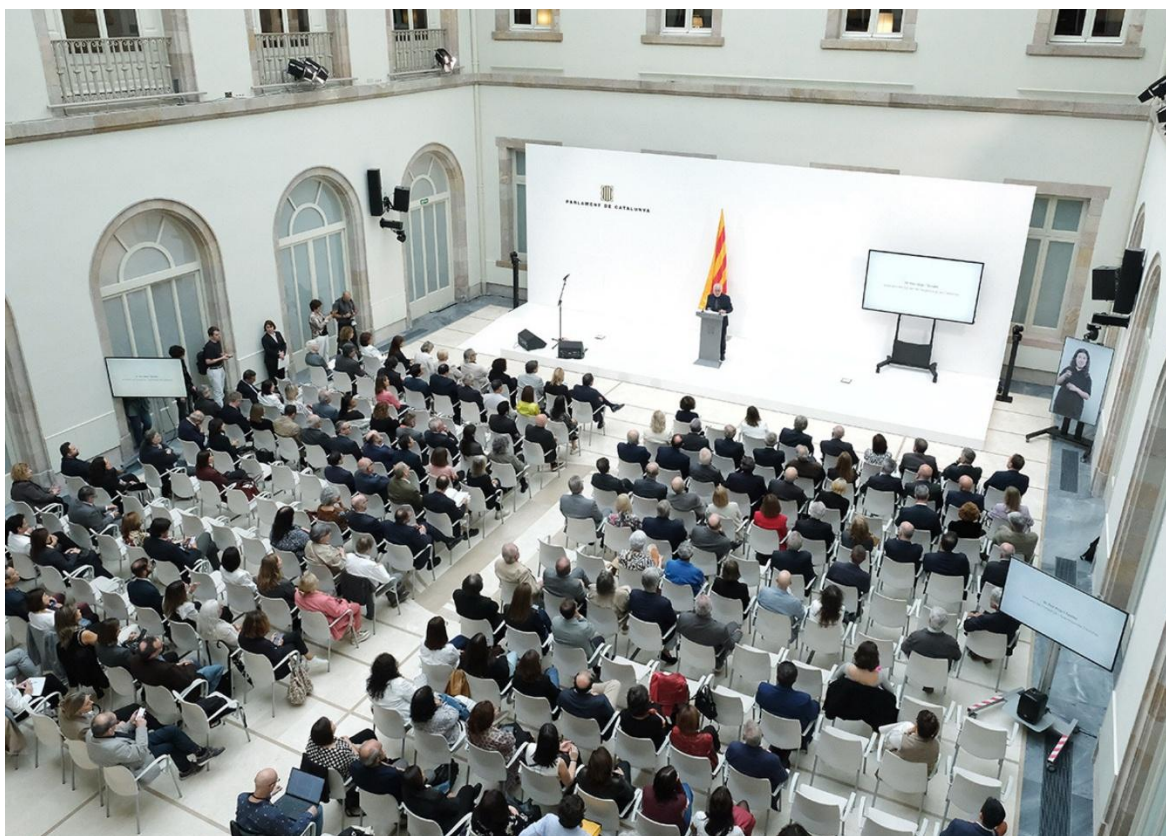
Acte institucional de celebració del 25è aniversari del CAC al Parlament el 13 d'octubre.