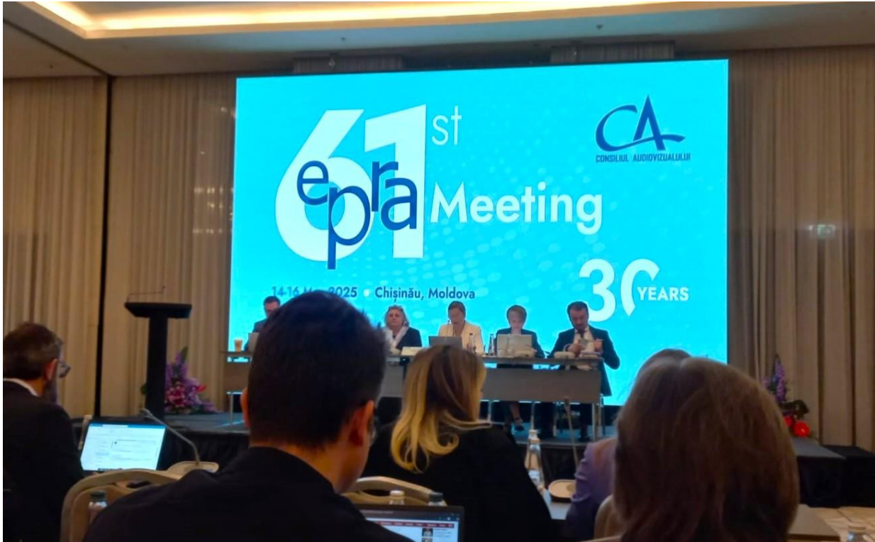
Sessió plenària de la 61a reunió de l'EPRA a Chisinau (Moldàvia) el 15 de maig.

reducció de la transparència editorial. En la segona sessió plenària, s'hi va analitzar com establir estratègies en un entorn de desenvolupament ràpid.