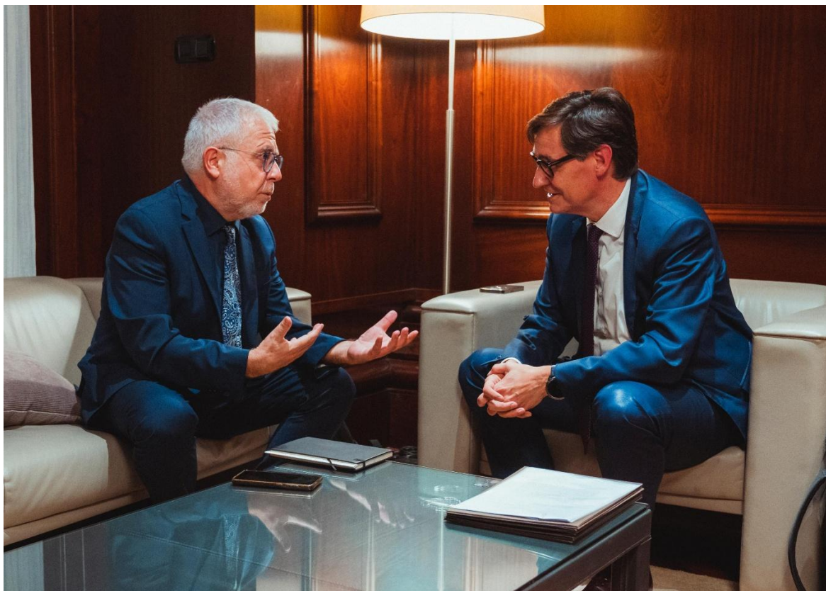
El president del CAC, Xevi Xirgo, i el president de la Generalitat de Catalunya, Salvador Illa, al Parlament de Catalunya el 9 d'octubre.