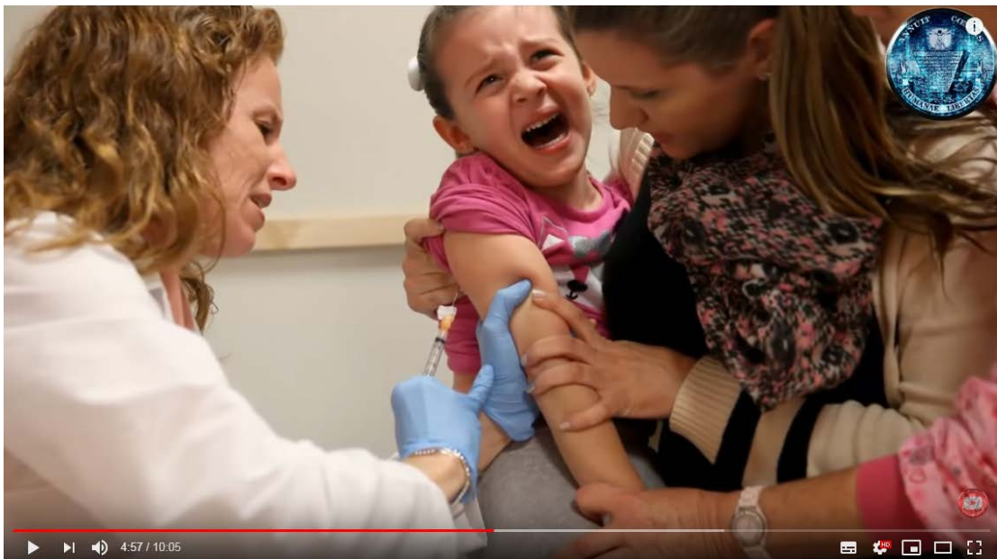
PRIMER ESTUDIO ENTRE NIÑOS VACUNADOS Y NO VACUNADOS REVELA LA OSCURA VERDAD

(10 ingredientes tóxicos dentro de las vacunas)