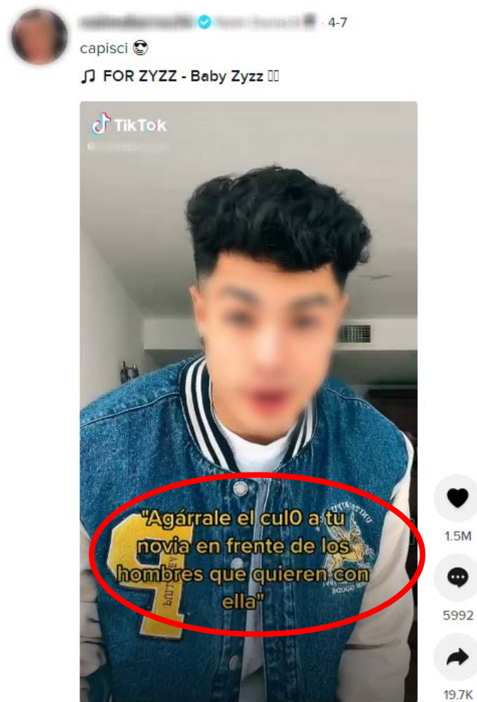
(Vídeo núm. 8)

Són continguts en què es fa referència a la parella heterosexual d'una dona com el seu amo ("¡Es mía! Sí tiene dueño ¿Cómo que no tiene dueño?") o bé s'aconsella grapejar el cos de la dona com a senyal de possessió davant d'altres homes ("Agárrale el culo a tu novia en frente de los hombres que quieren con ella"):